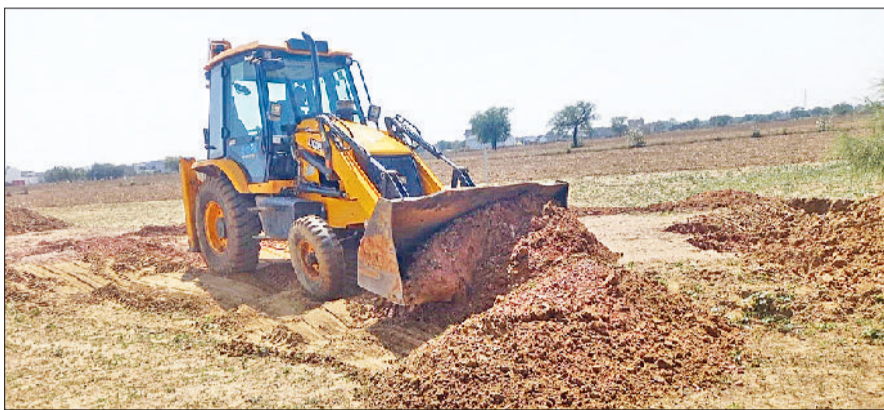
रेवाड़ी। अवैध कॉलोनी में चलती डीटीपी की जेसीबी।