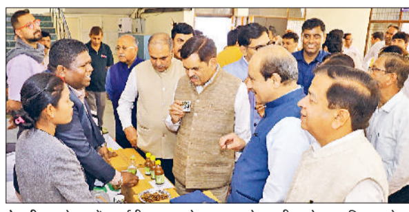
रेवाड़ी। सम्मेलन में प्रदर्शनी का अवलोकन व आयोजन टीम को सम्मानित करते हुए अतिथि।