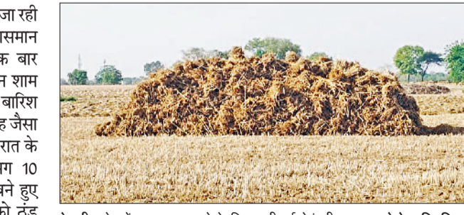
रेवाड़ी। खेत में काटकर सुखाने के लिए रखी हुई गेहूं की फसल।

अप्रैल के शुरू में ही किसानों को बार-बार परेशान कर चुके मौसम ने राहत देना शुरू कर दिया है। आसमान में छाने वाले बादलों का दौर कुछ समय के लिए रुक गया है। मौसम का मिजाज अभी भी ठंडा बना हुआ है, लेकिन जल्द इसके गर्माने के आसार नजर आने लगे हैं। चार-पांच दिन आसमान साफ रहने के बाद अगले सप्ताह मौसम में फिर