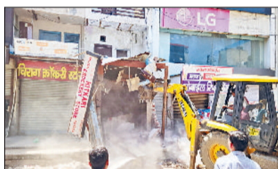
रेवाड़ी। रेलवे रोड पर दुकान तोड़ने हुए जेसीबी, नप की कार्रवाई के दौरान मौजूद पुलिस व लोग।