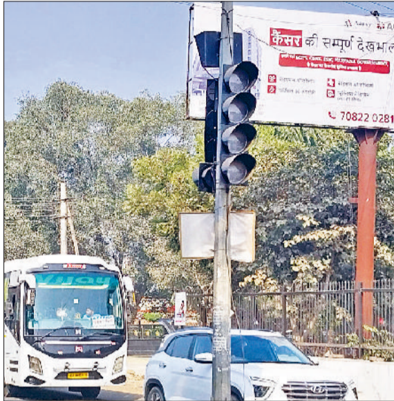
रेवाड़ी। अग्रसेन चौक पर बंद पड़ी ट्रैफिक लाइटें, अबेडकर चौक पर बंद पड़ी ट्रैफिक लाइटें।

नगर परिषद की ओर से शहर के प्रमुख चौराहों पर ट्रैफिक लाइटें सुचारू करने की दिशा में कोई कदम नहीं उठाए जा रहे हैं। शहर में लंबे समय से ट्रैफिक लाइटें बंद पड़ी हुई हैं। ट्रैफिक लाइटों के मटेनेंस व नई लाइटें लगाने के प्रति वर्ष लाखों रुपये बर्बाद हो जाते हैं, लेकिन लाइटें चालू नहीं हो पाती हैं। वर्तमान में शहर के कई चौराहों पर लगी ट्रैफिक लाइटें शोपीस बनकर लटकी हुई हैं। शहर में रोजाना बढ़ते ट्रैफिक में व्यवस्था बनाने के लिए ट्रैफिक लाइटों का संचालन बेहद जरूरी है, लेकिन प्रशासन की ओर से इस ओर कोई ठोस कदम नहीं उठाए जा रहे हैं। नगर परिषद भी ट्रैफिक लाइटों को चालू करने में सुस्त हो चुकी है। फिलहाल शहर के चौराहों पर लगी ट्रैफिक लाइटें जहां टूटकर लटकी हुई हैं वहीं लाइटों की लाल-हरी बत्ती में करंट भी नहीं दौड़ रहा है।