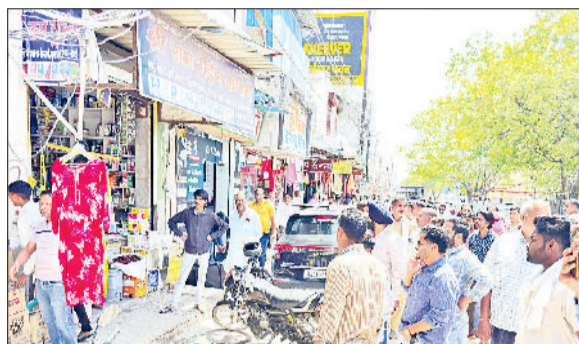
रेवाड़ी। दुकानों के आगे रखे सामान को हटवाते हुए विभाग के एसडीओ।

कोसली स्टेशन क्षेत्र के बाजार में अतिक्रमण और अवैध कब्जे हटाने के लिए नोटिस जारी किए जाने के 15 दिन बाद विभाग शुक्रवार को कार्रवाई के लिए मैदान में उतरा, लेकिन यह कार्रवाई केवल खानापूर्ति तक सीमित रही। रेलवे रोड बाजार में चल रहे अवैध टैक्सी स्टैंड पर कोई कार्रवाई नहीं की गई, जिससे लोगों को पार्किंग की समस्या और जाम का सामना करना पड़ रहा है। लघु सचिवालय में आयोजित समाधान शिविर में एक दुकानदार ने बाजार में बढ़ते अतिक्रमण को लेकर एसडीएम विजय कुमार से शिकायत की थी, जिसके बाद एसडीएम ने लोक निर्माण विभाग को अतिक्रमण हटाने के आदेश दिए थे। विभाग ने 24 मार्च को नोटिस जारी कर एक सप्ताह के भीतर अतिक्रमण हटाने के निर्देश दिए थे। नोटिस जारी होने के बाद कुछ दुकानदारों ने अपनी दुकानों के आगे बने टिन शेड हटा लिए और कुछ रेहड़ी-पट्टी वालों ने भी स्थान बदल लिया। कई दुकानदारों ने